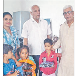
पानीपत। नीलकंठ मानव सेवा संस्थान के पदाधिकारी बच्चों को ड्रेस भेंट करते हुए।