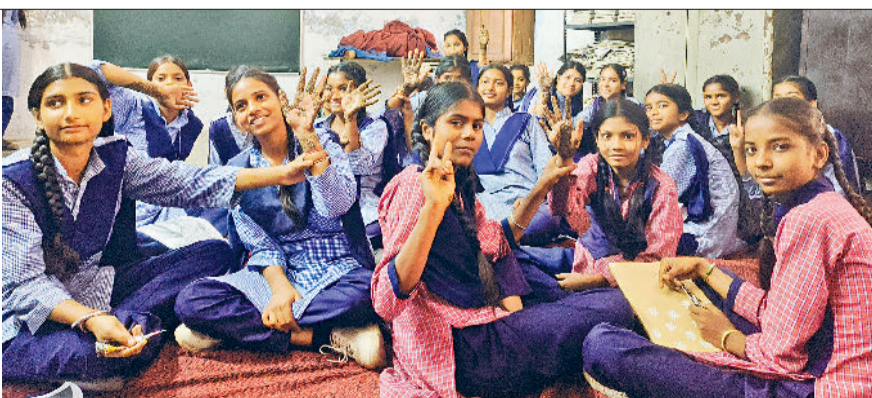
अंबाला। स्कूली छात्राएं हाथों पर मेहेंदी लगाकर वोट मेरा अधिकार का संदेश देती हुईं।

मतदान के महत्व का संदेश दिया जा रहा है। रंगोली, मेहेंदी और पेंटिंग प्रतियोगिताओं के माध्यम से मतदान के प्रति जागरूकता फैलाने का अनूठा प्रयास किया जा रहा है। इन प्रतियोगिताओं में छात्र अपनी कला के जरिए लोकतंत्र के महत्व को दर्शा रहे हैं जिससे यह संदेश जन-जन तक प्रभावी ढंग से पहुंच रहा है। कैम्पस एंबेसडर की भूमिका भी इस अभियान में बेहद महत्वपूर्ण है। युवा एंबेसडर विद्यालयों और आसपास के क्षेत्रों में महिलाओं और युवाओं को मतदान के प्रति शिक्षित और जागरूक कर रहे हैं। विशेष रूप से युवा लड़कियों, गृहिणियों और कारखानों व लघु उद्योगों में कार्यरत महिलाओं को लक्षित कर उन्हें मतदान के अधिकार और उसकी शक्ति के बारे में बताया जा रहा है। यह पहल महिलाओं की भागीदारी बढ़ाने की दिशा में एक मजबूत कदम साबित हो रही है। सोशल मीडिया