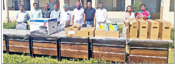
शहजादपुर। जरूरी सामान उपलब्ध करवाती जप सदस्य।