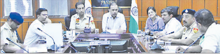
पानीपत। नीट की परीक्षा को लेकर बैठक करते हुए उपायुक्त डॉ. वीरेंद्र दहिया, एसपी भूपेंद्र सिंह आदि।

परीक्षा केंद्रों पर पीने के पानी की व्यवस्था और एंबुलेंस की उपलब्धता हो